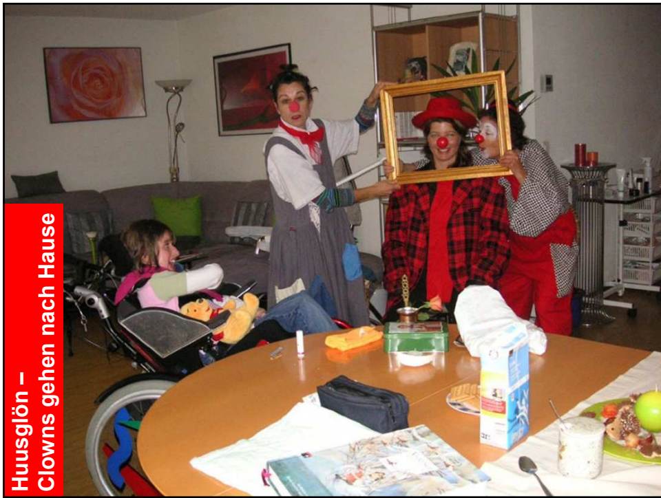
Huusglön – Clowns gehen nach Hause