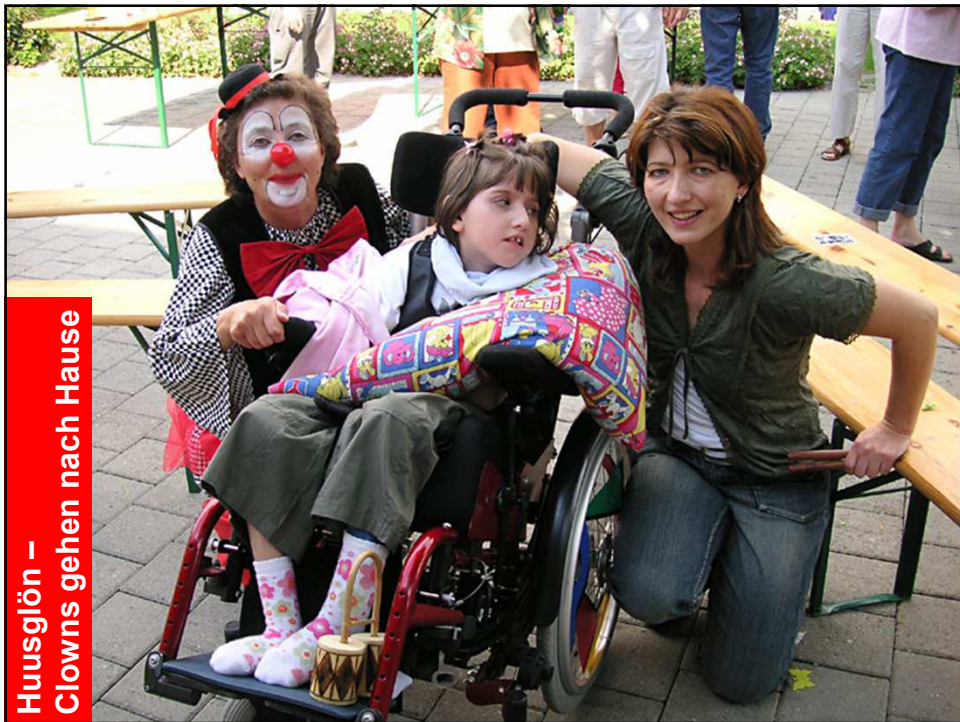
Huusglön – Clowns gehen nach Hause